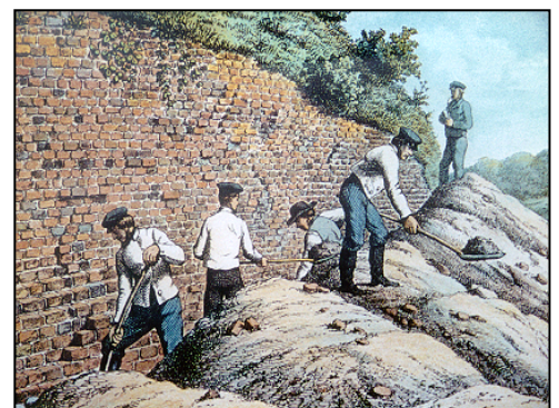
Sådan mener man, det så ud, da Valdemarsmuren blev udgravet i 1800-tallet.

Det bør bemærkes, at et besøg kræver, at man hjemmefra har arbejdet med emnet. Eleverne bør nok også forberedes på, at det ikke er Den kinesiske Mur, de skal beskue, men derimod et meget beskedent afsnit af Valdemarsmuren.